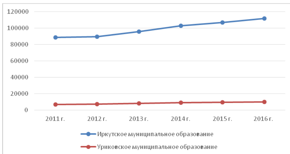
Рис. 1. Динамика численности постоянного населения, чел.